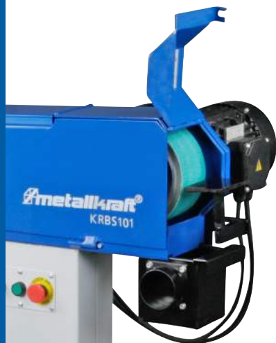
HÁTSÓ RÉSZ PEREMCSISZOLÓVAL, PRAKTIKUS MUNKADARABTARTÓVAL ÉS ELSZÍVÓVAL