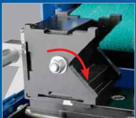
▶ A forgatható pófák lehetővé teszik a biztonságos befogást kerek-, négyzetűd, és lapos acélcsövek esetén. ▶ A prizmapófák megkönnyítik a munkadarabok befogását ▶ A kiegészítő rögzítőprofilok a munkadarabok pontos szorítását segítik, mint például a laposacél vagy a szögletes csövek.